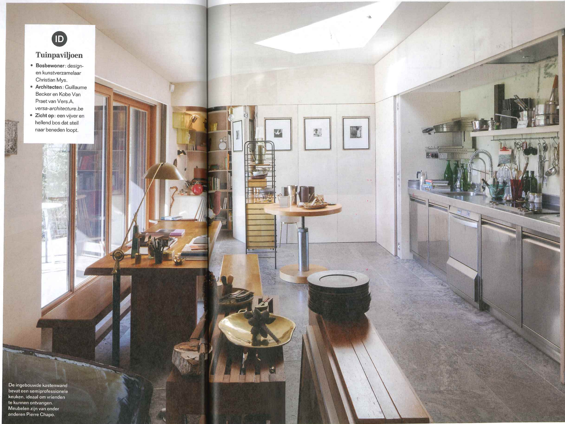
De ingebouwde kastenwand bevat een semiprofessionele keuken, ideaal om vrienden te kunnen ontvangen. Meubelen zijn van onder anderen Pierre Chapo.