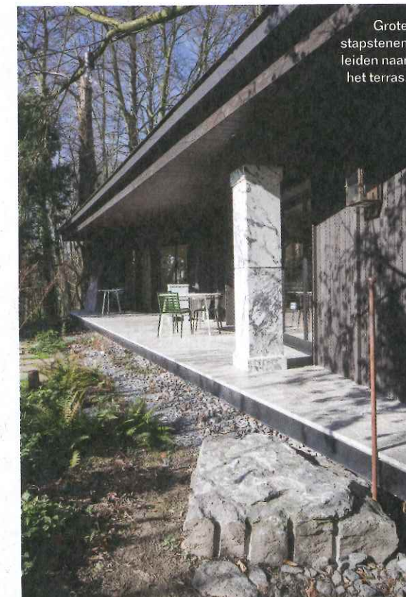
Grote stapstenen leiden naar het terras.

“De buitenkant lieten we in Thermowood afwerken en behandelen met donkere olie, om het paviljoen als het ware te laten verdwijnen in het bos”