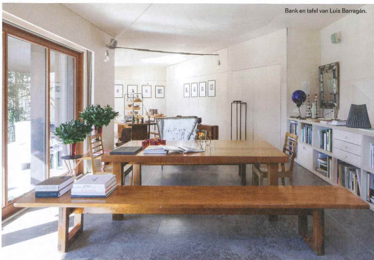
Bank en tafel van Luis Barragán.

“De buitenkant lieten we in Thermowood afwerken en behandelen met donkere olie, om het paviljoen als het ware te laten verdwijnen in het bos”