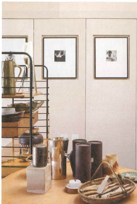
De vintage meubelen contrasteren mooi met de lichte berkenmultiplex die de architecten kozen voor het interieur. Lichtinval komt van de grote terrasramen, maar ook van de atypische dakkapellen.