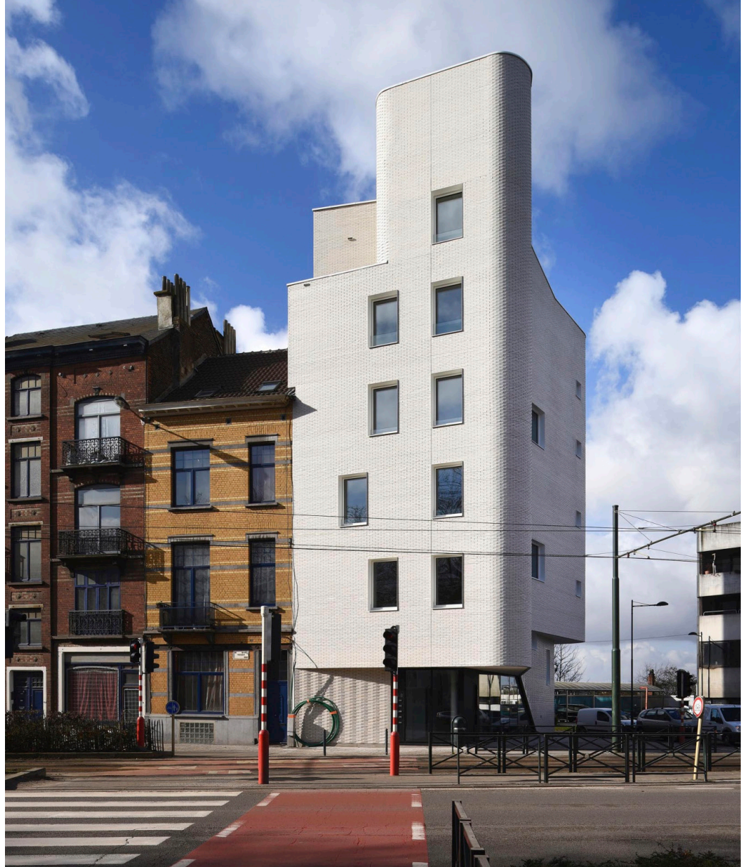
FIGURE de proue